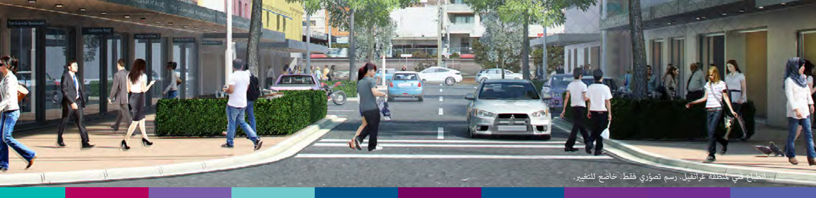
الطريق هي المنطقة غراففيل، رسم تصوّري فقط، خاضع للتغيير.

بعد ثلاث سنوات من التعاون والتشاور مع البلديات الواقعة في "محيط باراماتا رود" والمجتمعات المقيمة فيه أصبح لدينا الآن إستراتيجية تدعم النمو والتغيير والاستثمار.