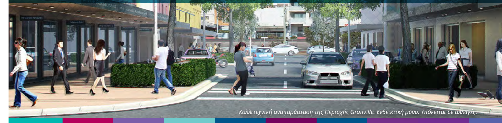
Καλλιτεχνική αναπαράσταση της Περιοχής Granville. Ενδεικτική μόνο. Υπόκειται σε αλλαγές.

Μετά από τρία χρόνια συνεργασίας και διαβούλευσης με τα δημοτικά συμβούλια και τις κοινότητες κατά μήκος του Οδικού Άξονα Parramatta Road τώρα έχουμε μια Στρατηγική που θα διέπει την ανάπτυξη, τις αλλαγές και τις επενδύσεις στην περιοχή.