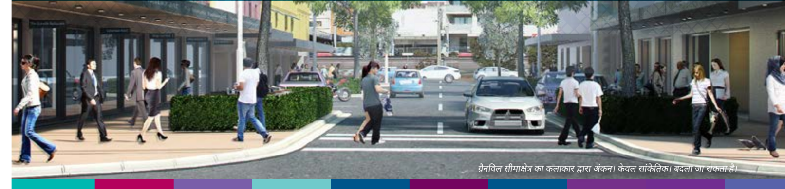
पैनविल सीमाक्षेत्र का कलाकार द्वारा अंकन। केवल सांकेतिक। बदला जा सकता है।

पैरामैटा रोड गलियारे के किनारे-किनारे की काउन्सिलों व समुदायों के साथ तीन वर्ष तक सहयोग व विचार-विमर्श करने के बाद हमारे पास अब एक कार्यनीति है जो विकास, परिवर्तन व निवेश का मार्गदर्शन करेगी।